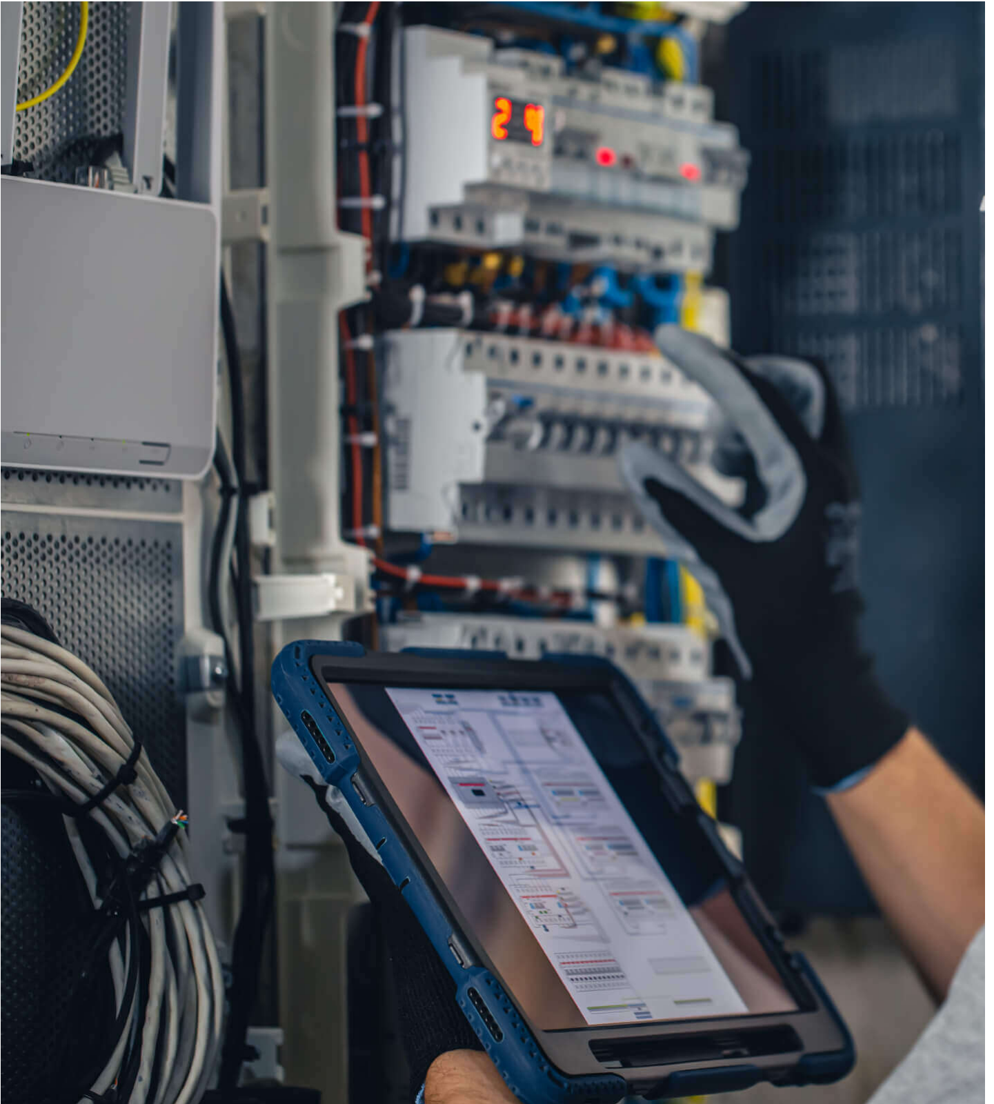
구형 장비 유지보수